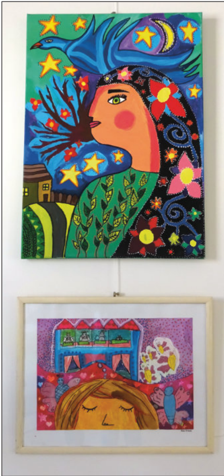
Gyereknapi képekben (folytatás 2. oldalról)