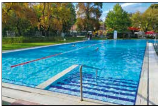
A strandmedencében továbbra is lehet úszni

sai miatt a vártnál is magasabba emelkedtek, így a sátrát üzemeltető KÓPÉ Ú.V. SE egyelőre nem tudta az úszómedencét befedni. A