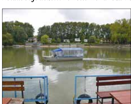
A rév az Ebihal büfétől indul

A Lupa Egyesület felajánlásából épült meg a 12 utas szállítására alkalmas alumínium hajótest, s az engedélyeztetés hosszú eljárását is az egyesület intézte. A hajómotort egy pályázat révén, állami és önkormányzati segítséggel sikerült beszerezni. Októberben a komp reggel 7 és 17 óra között óránként közlekedik a Lupa-sziget és az Ebihal büfé között . Felntteknek az oda-vissza út 1000, diákoknak 900 Ft, 6 év alatti gyerekeknek pedig ingyenes.