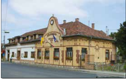
A Polgármesteri Hivatal Budakalászon

A 2022. évi költségvetési rendelet módosítása során a megemelkedett közműdíjak fedezete érdekében a dologi kiadások terhére jelentős átcsoportosítást hajtott végre a testület. A módosítás az üzemanyagárak növekedése miatt várható ideai többletkiadásokra is fedezetet teremtett. A pályázatokból származó többletbevételek, valamint a dologi kiadások viszszavágása révén szintén jelentősen csökkentették az önkormányzati finanszírozást és a takarékos előrelátás érdekében további előirányzat-módosításokat hajtottak végre. A bizonytalan társadalmi és gazdasági környezet miatt megnövekedett kockázatok kezelésére a képviselő a költségvetés általános tartalmát 105 millió forinttal növelték. A KSH adatai alapján az infláció mértéke jóval meghaladta az előrejelzéseket: 2022 augusztusában 15,6 százalék volt, és további emelkedés várható. Az élelmiszerek egy év alatt 31 százalékkal drágultak.