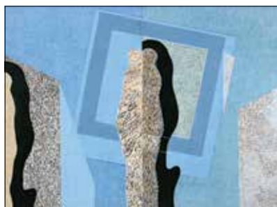
Deim Pál: Csend, 1968

Deim Pál (Szentendre, 1932. június 29. – Szentendre, 2016. május 9.) Kossuth-díjas festőművész születésének 90. évfordulójára átfogó életmű kiállítást nyit a Ferenczy Múzeumi Centrum. A tárlat az életmű fontos korszakait és csomópontjait mentén tekintti át a művész munkásságát és hangsúlyt kapnak olyan, ma is releváns témák, mint az emlékmű/